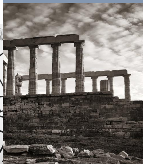
TEMPLO DE POSEIDON