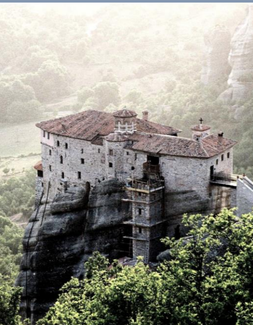
MONASTERIOS DE METEORA

— CHARLAS — DE MITO ASTROLOGIA Y RITUALES EN ESPACIOS MAGICOS Y PATRIMONIOS DE LA HUMANIDAD *ACROPOLIS *FUENTE DE AFRODITA *OLYMPIA *ORÁCULO DE DELFOS *TEMPLO DE POSEIDÓN *SANTUARIO DE ARTEMIS *SANTUARIO DE ESCULAPIO