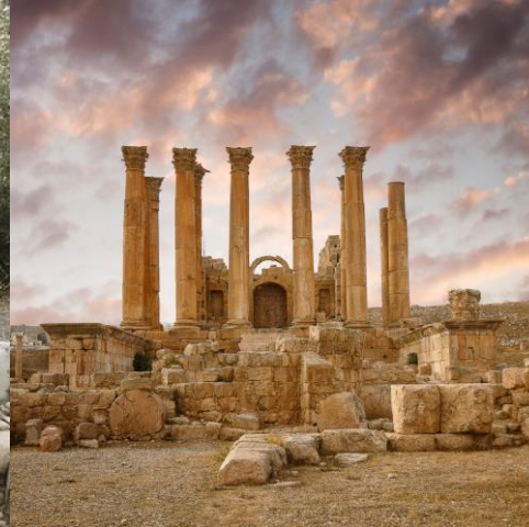
SANTUARIO DE ARTEMIS