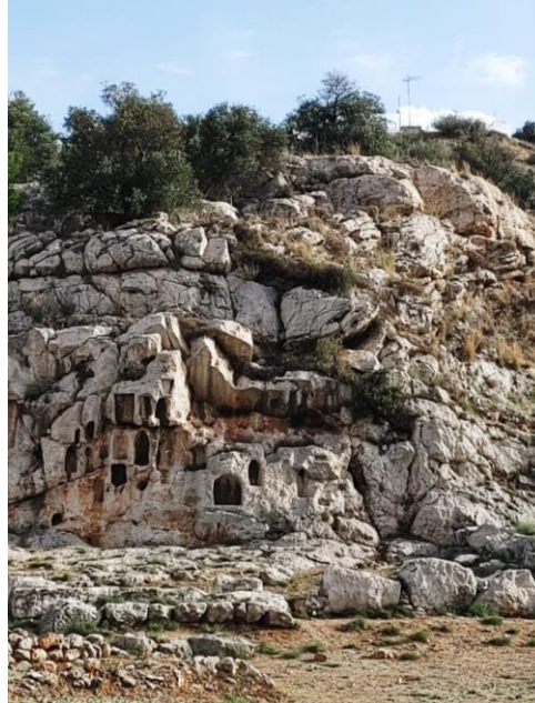
SANTUARIO DE AFRODITA

— CHARLAS — DE MITO ASTROLOGIA Y RITUALES EN ESPACIOS MAGICOS Y PATRIMONIOS DE LA HUMANIDAD *ACROPOLIS *FUENTE DE AFRODITA *OLYMPIA *ORÁCULO DE DELFOS *TEMPLO DE POSEIDÓN *SANTUARIO DE ARTEMIS *SANTUARIO DE ESCULAPIO