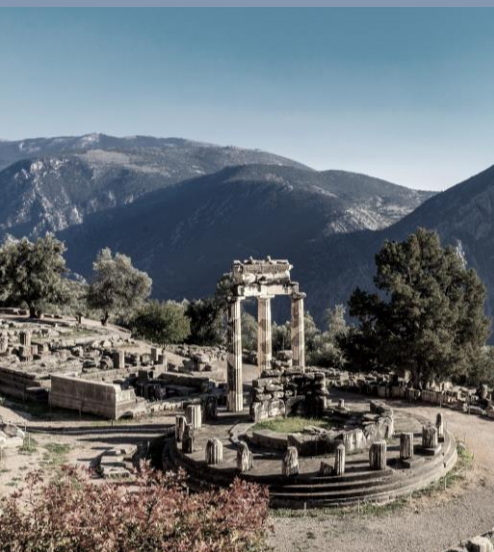
ORACULO DE DELFOS